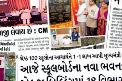
શ્રેષ્ઠ 100 સ્કૂલોના આચાર્યને 1-1 લાખ આપી મુખ્યમંત્રી દ્વારા સન્માનિત કરાશે

મ્યુનિ. શાળાઓમાં શિક્ષણનું સ્તર ઉચ્ચતમ, વિદ્યાર્થીની કાળજી લેવાય છે : CM એમ. સુભાષીએ જણાવ્યું કે મ્યુનિ. શાળાઓમાં શિક્ષણનું સ્તર ઉચ્ચતમ છે. વિદ્યાર્થીની કાળજી લેવાય છે. આમદાવાદ સરકારના સુવરિયેલોની મુલાકાત લીધી. શ્રેષ્ઠ 100 સ્કૂલોના આચાર્યને 1-1 લાખ આપી મુખ્યમંત્રી દ્વારા સન્માનિત કરાશે આજે સ્કૂલબોર્ડના નવા ભવનનું લોકાર્પણ એક જ બિલ્ડિંગમાં 18 વિભાગ કામ કરશે 2 વર્ષથી કચેરી પાલડીમાં ખસેડાઈ હતી, નવી ઓફિસથી પેન્શનરોને વધુ ફાયદો થશે પહેલેવાર તરફનો ટીમ દ્વારા સ્કૂલોનું મૂલ્યાંકન કરવામાં આવ્યું છે. 100 સ્કૂલોના આચાર્યને 1-1 લાખ આપી મુખ્યમંત્રી દ્વારા સન્માનિત કરાશે. આજે સ્કૂલબોર્ડના નવા ભવનનું લોકાર્પણ એક જ બિલ્ડિંગમાં 18 વિભાગ કામ કરશે. 2 વર્ષથી કચેરી પાલડીમાં ખસેડાઈ હતી, નવી ઓફિસથી પેન્શનરોને વધુ ફાયદો થશે.