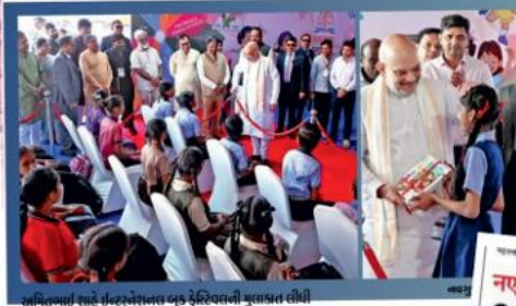
આમદાવાદ સરકારના સુવરિયેલોની મુલાકાત લીધી