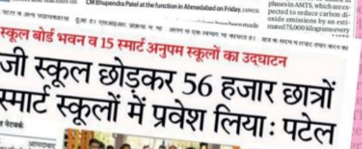
CM Bhupendra Patel at the function in Ahmedabad on Friday.

CM inaugurates 15 smart schools, calls for integration of knowledge & technology Almedabad Municipal School Board will now function from the new smart school building school Board Bhuvan at Navrangpura. Making administrative professional and know efficient. Inauguration ceremony, Patel inaugurated 15 new smart schools in the list of Ahmedabad Municipal Corporation's Smart School Scheme (AMSS) on Friday. A total of 25 new e-buses are expected to be added in the list of Ahmedabad Municipal Corporation's Smart School Scheme (AMSS) on Friday. CM Bhupendra Patel at the function in Ahmedabad on Friday.