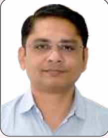
ડૉ. પરિમલ એ. પટેલ નાયબ શાસનાધિકારી